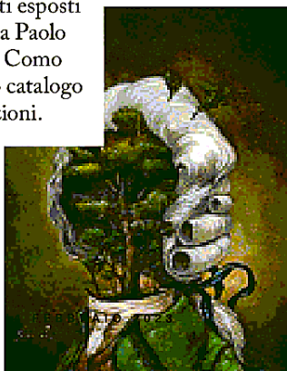
Un'opera da Cosimo di Roger Olmos.